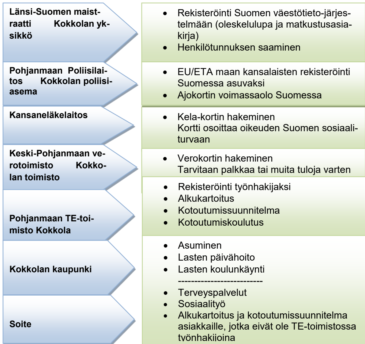
Kuvio 5. Alkuvaiheen asiointiyhteydet

Suomeen ja kuntaan asettumisen alkuvaiheessa on hoidettava seuraavat viranomaisasiat: