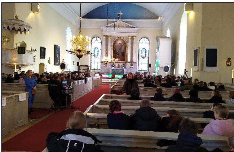
Taidetestaajat Folk Extreme -konsertissa Oulun tuomiokirkossa 26.1.2026