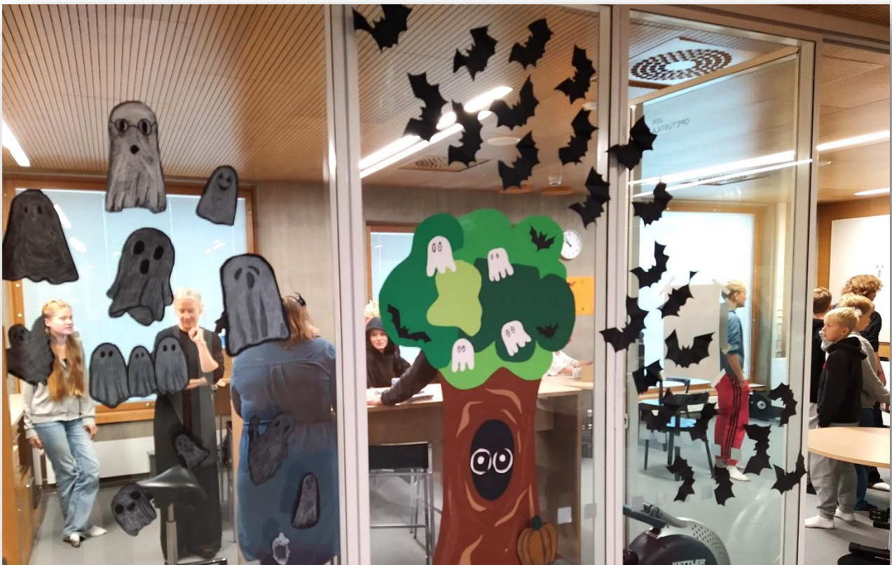
Halloweenia vietettiin 24.10.2025 välituntitoiminnan merkeissä