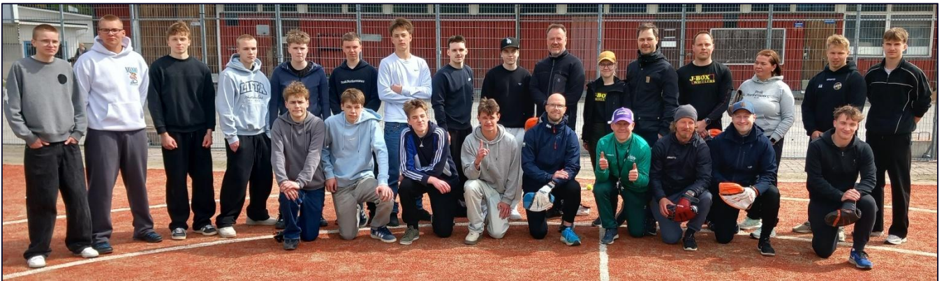
Oppilaiden ja henkilökunnan välinen pesäpalloturnaus pelattiin Santahaan kentällä 27.5.2026