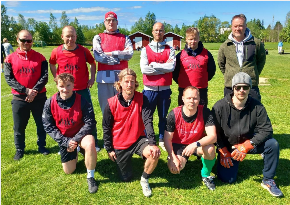
Henkilökunnan jalkapallojoukkue 28.5.2026