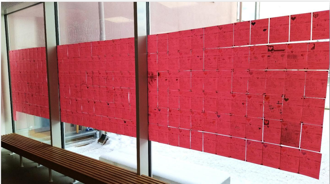
Koulun ystäväkirja, jossa jokaisella oppilaalla oli oma sivunsa.