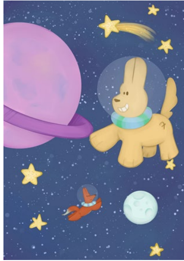
Kuva 2 Avaruus