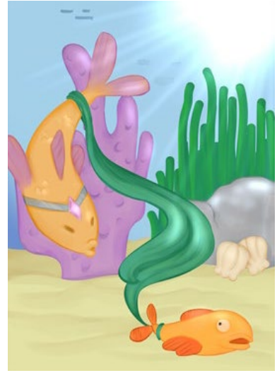
Kuva 3 Pusukala

Huom. Tarinan voi kirjoittaa joko omalle paperille tai tulostaa seuraavan sivun ja kirjoittaa siihen. Jos teet tehtävän omalle paperille, muista kirjoittaa siihen myös hakijan nimi sekä huoltajan nimi ja sähköpostiosoite.