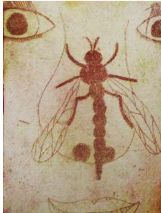
Venla Rintalahti: Kärpänen

Työpajoissa oppilas keskittyy lukukausittain tai lukuvuosittain yhteen valitsemaansa työpajaan. Kaikki opetus sisältää pieniä kotitehtäviä sekä tunneilla tehtäviä yhteisiä näyttelykäyntejä ja muuta taiteen tarkastelua, retkiä ja tutustumiskäyntejä. Niiden avulla tutkitaan ympäristöä, mennyttä ja nykyistä kulttuuria - koko elämää.