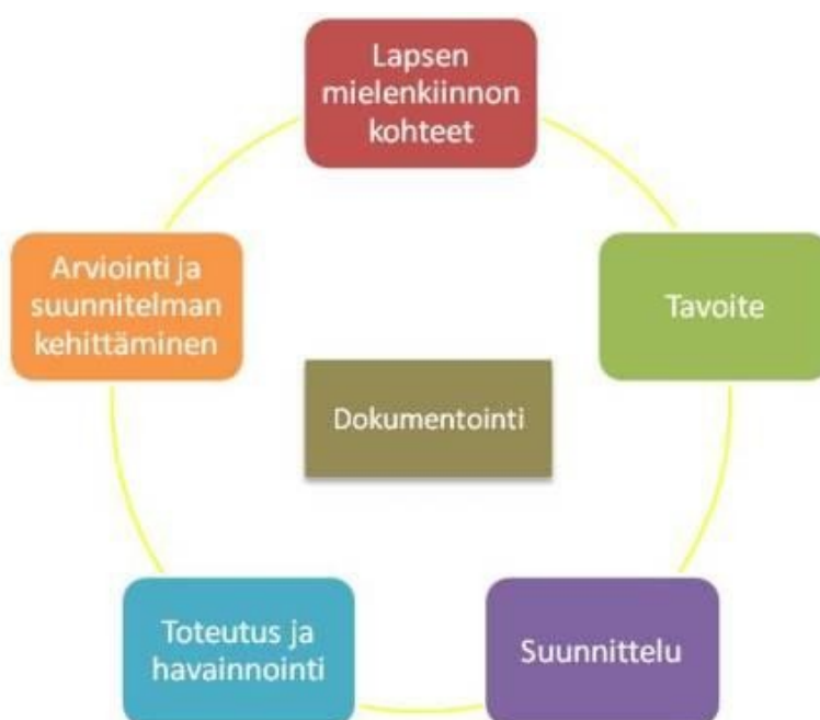
Kuva: Lähtökohtia arviointiin

Lasten kehittyminen ja oppiminen tehdään näkyväksi dokumentoinnin kautta. Dokumentointi on vahvasti mukana joka vaiheessa, mm. lasten mielipiteiden, kokemusten ja tuotosten muodossa. Monipuolista lasten kehittämisestä ja oppimisesta koottua tietoa käsitellään säännöllisesti sekä lasten että huoltajien kanssa. On tärkeää, että lapsi itse oppii havaitsemaan vahvuutensa ja edistymisensä ja että huoltajat voivat tukea lastaan.