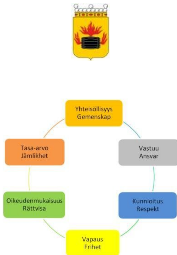
Kuva 1. Arvojen helminauha, joka on syntynyt yhteistyössä perusopetuksen kanssa, OPS-valmennuksen aikana.

Kuntakohtaisen opetussuunnitelman arvoja täydentävät yksikkökohtaiset arvot kirjataan lukuvuosisuunnitelmaan. Yksikkökohtainen arvokeskustelu toteutetaan henkilöstö, lapset ja huoltajat sekä mahdolliset muut yhteistyökumppanit osallistaen.