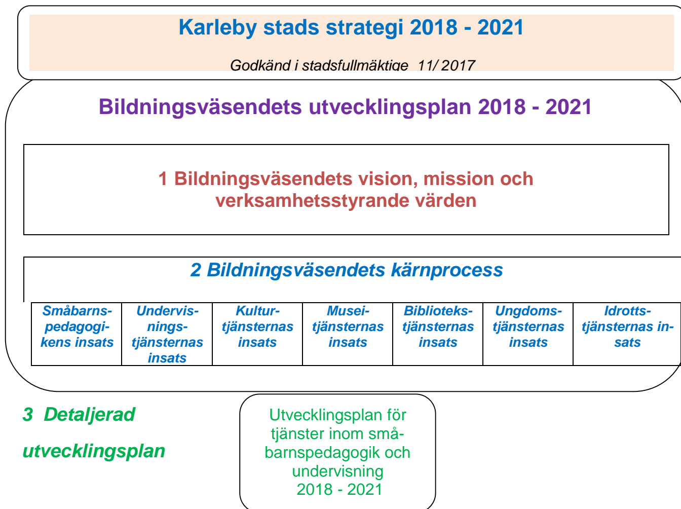
Figur 3: Strukturen för bildningsväsendets utvecklingsplan.

Kopplingen mellan stadsstrategin och bildningsväsendets utvecklingsplan presenteras i följande figur: