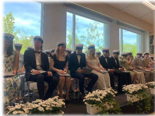
Studenter våren 2026