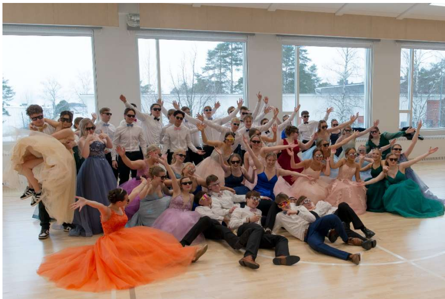
De gamlas dans 2025

De gamlas dag firas med en dansuppvisning i skolan på dagen och på kvällen gemensamt med de finska gymnasierna. Efter dansen i skolan samlas studerande och lärare till en gemensam kaffeservering. Det är önskvärt att alla tvåor deltar i de gamlas dag.