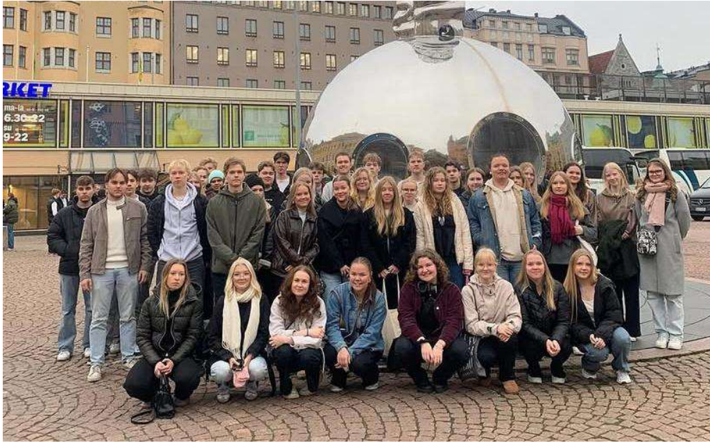
G23 på Kaserntorget i Helsingfors i november 2025.