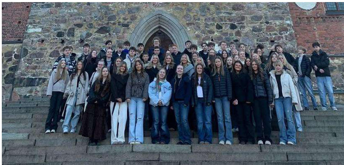
Grupp 24 på studiebesök till Åbo i mars 2026.