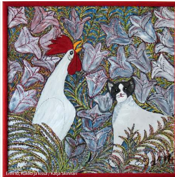
Enni Id, Kukka ja kissa / Katja Skinnari