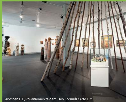
Arktinen ITE, Rovaniemen taidemuseo Korundi