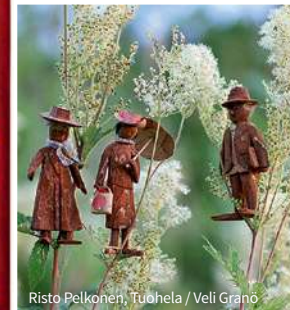
Risto Pelkonen, Tuohela / Veli Granö