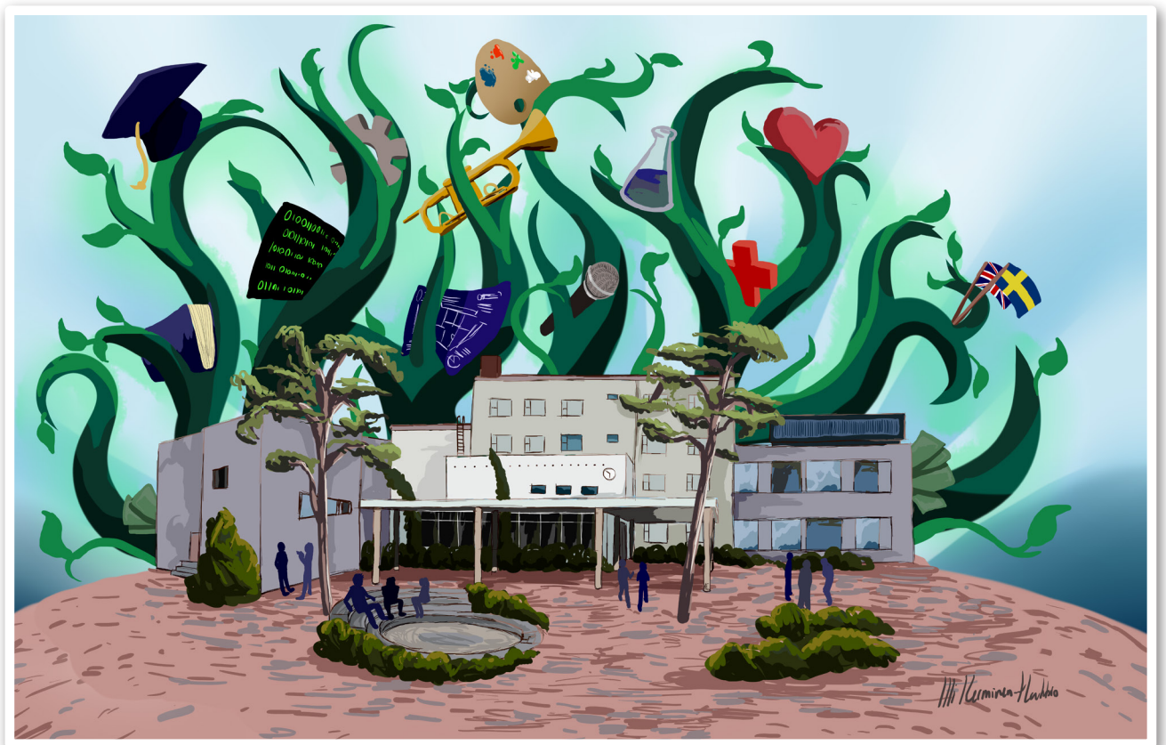
KAHDESTA YHDEKSI, piirros Illi Kerminen-Hakkio