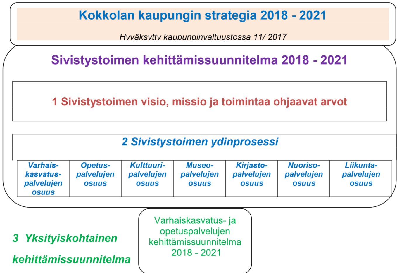
Kuvio 3. Sivistystoimen kehittämissuunnitelman rakenne.

Kaupunkistrategian ja sivistystoimen kehittämissuunnitelman välinen yhteys esitetään seuraavana kuviona: