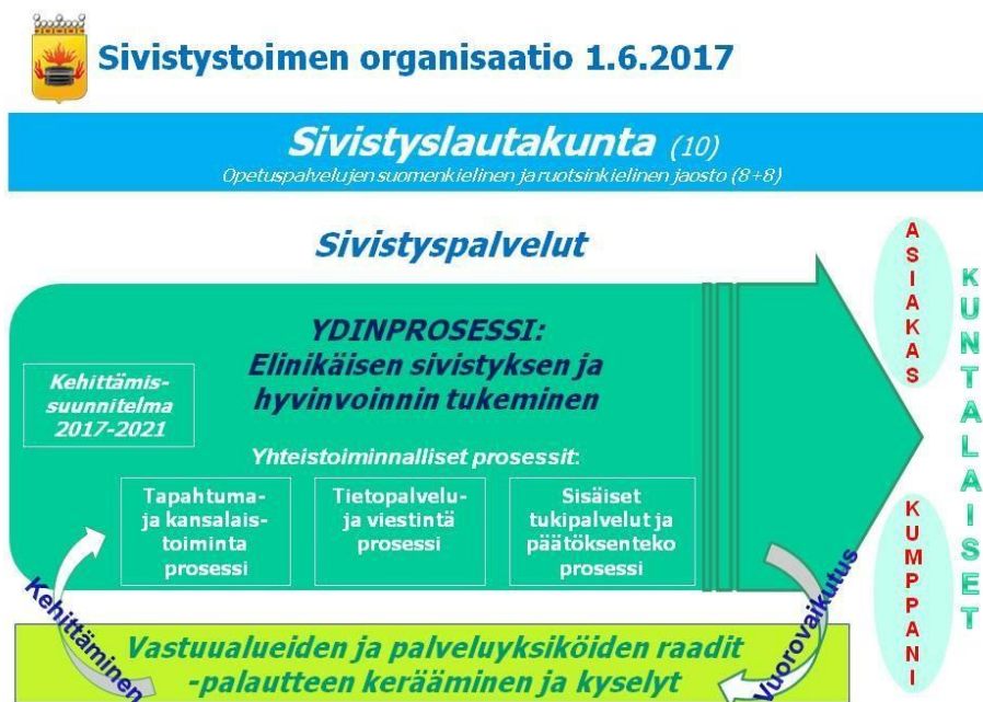
Kuvio 1. Sivistystoimen organisaatio 2017 prosessikuvauksena.

Sivistystoimen organisaatio uudistui uuden valtuustokauden alkaessa 1.6.2017. Organisaatio on kuvattu ydinprosessin ja kolmen yhteistoiminnallisen prosessin avulla. Sivistystoimen hallinto on järjestetty uuden mallin mukaisesti ja toiminnan uudistuminen kestää koko valtuustokauden ajan.