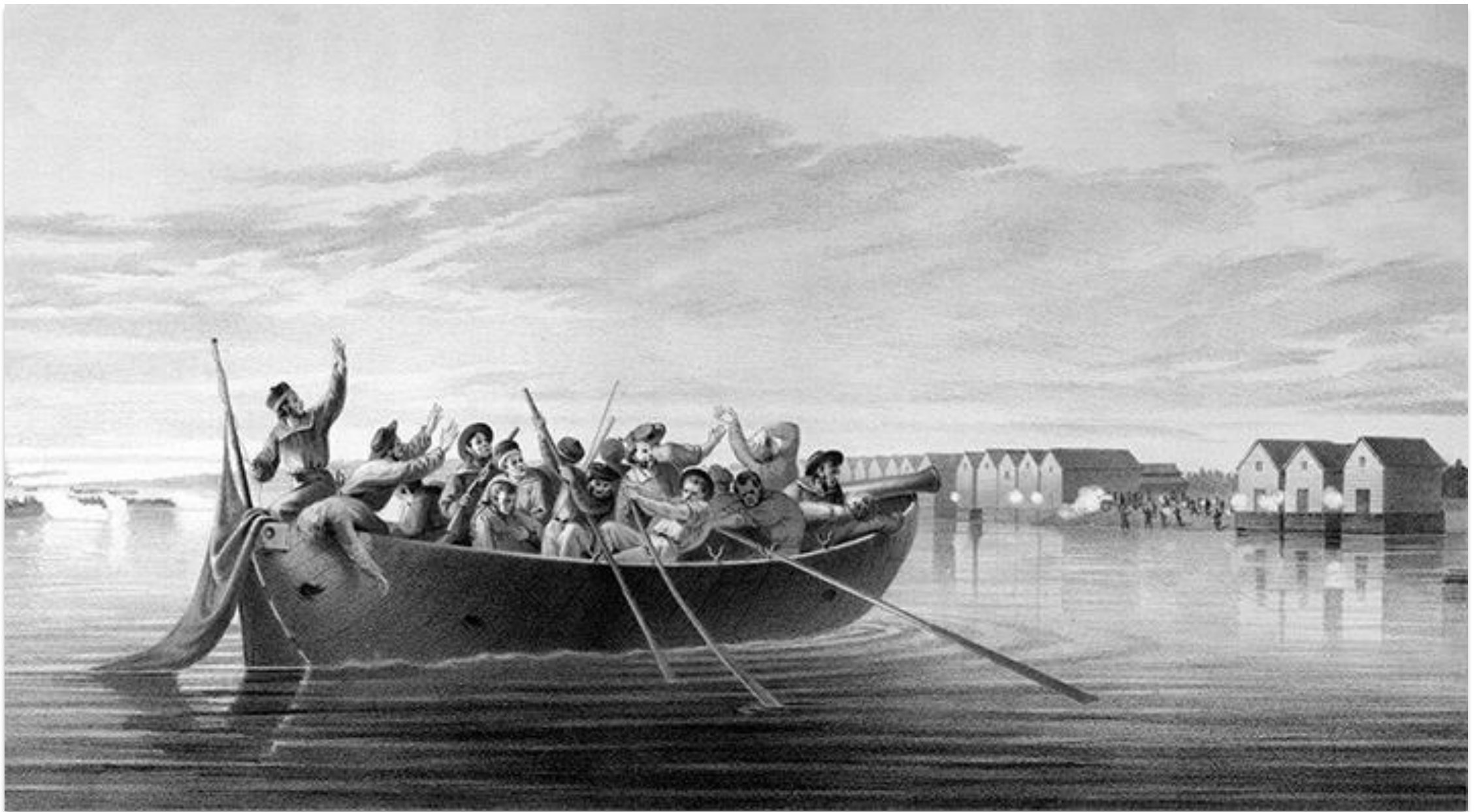
Litografi över Halkokariträffningen av Wladimir Swertschkoff (1855).