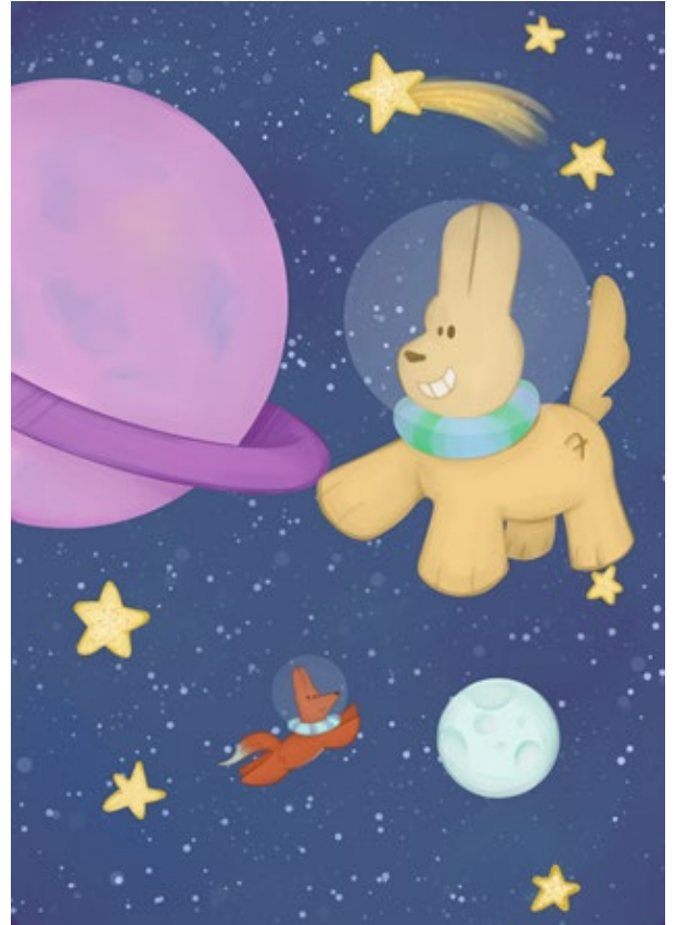
Kuva 2 Avaruus