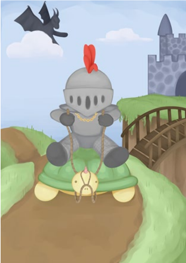
Kuva 1 Ritari